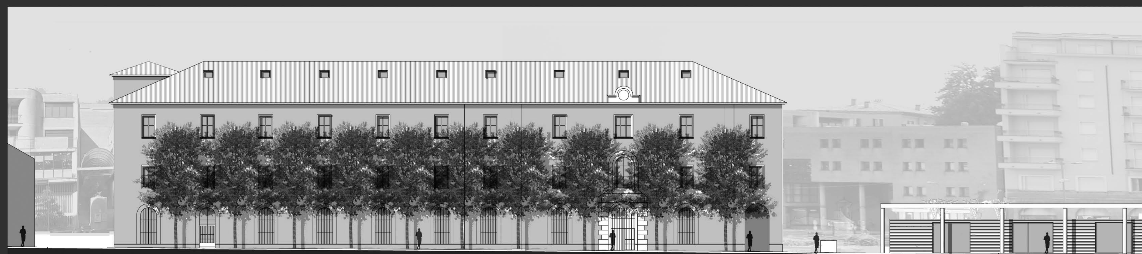
PROSPETTO NORD EST