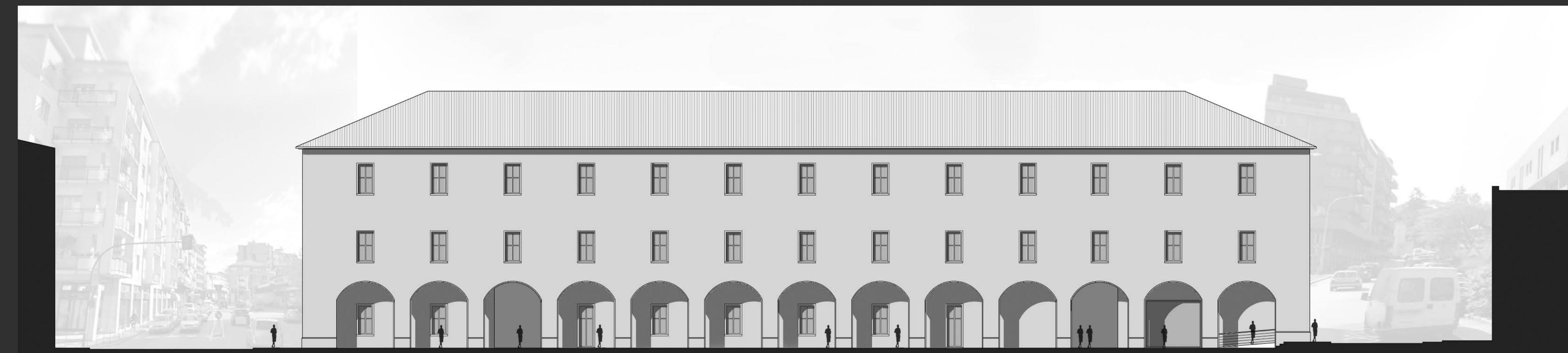
PROSPETTO NORD OVEST