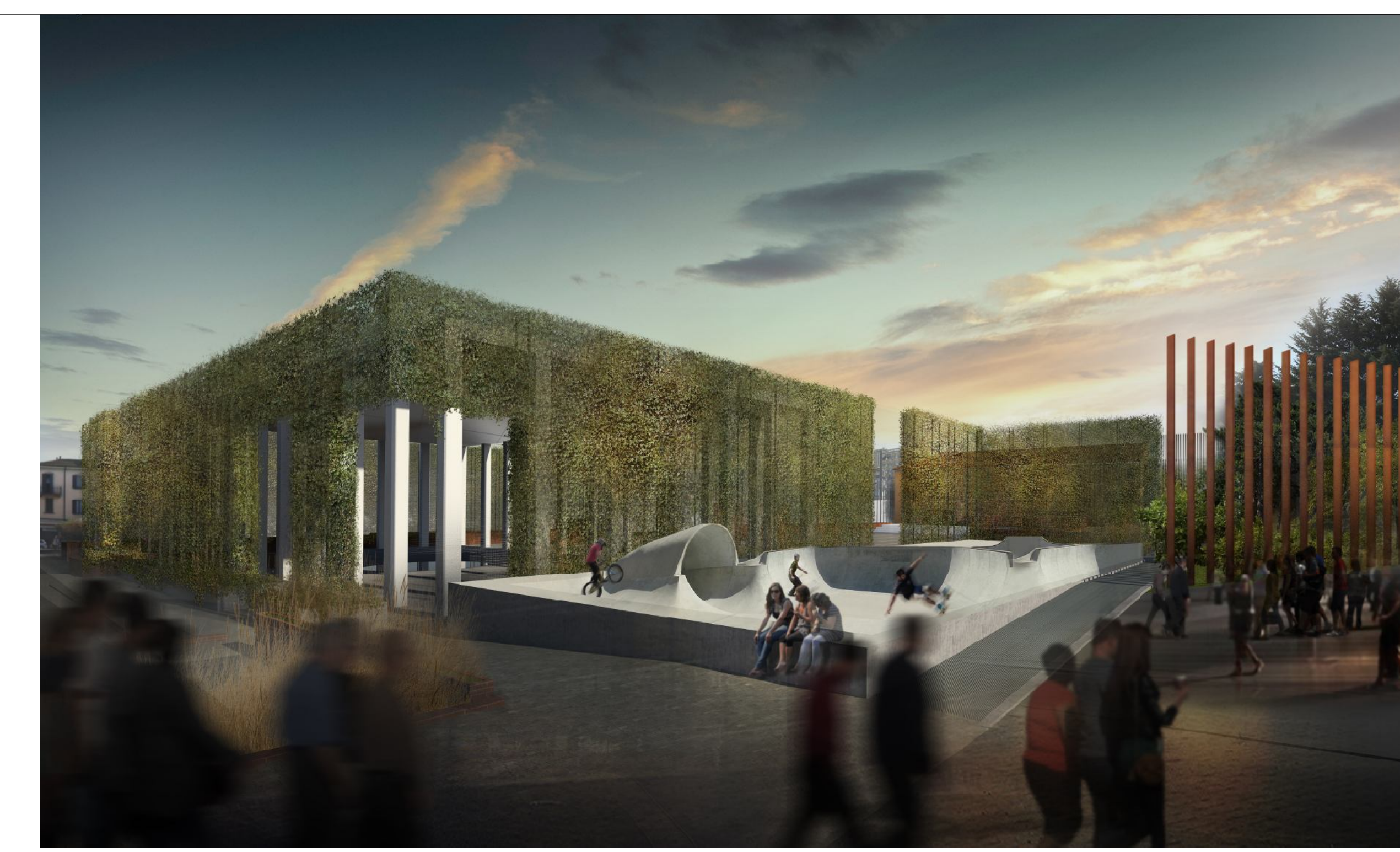
vista aggiuntiva .3