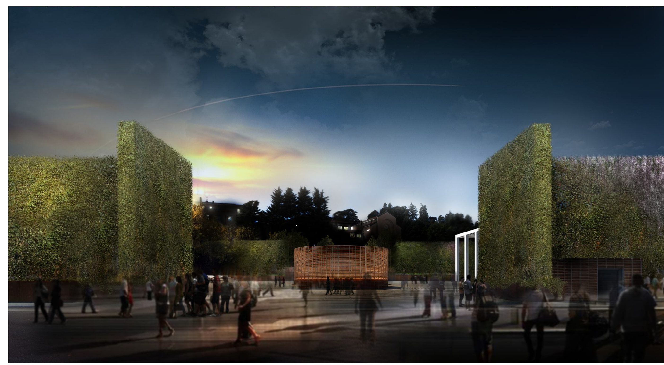
vista obbligatoria .2