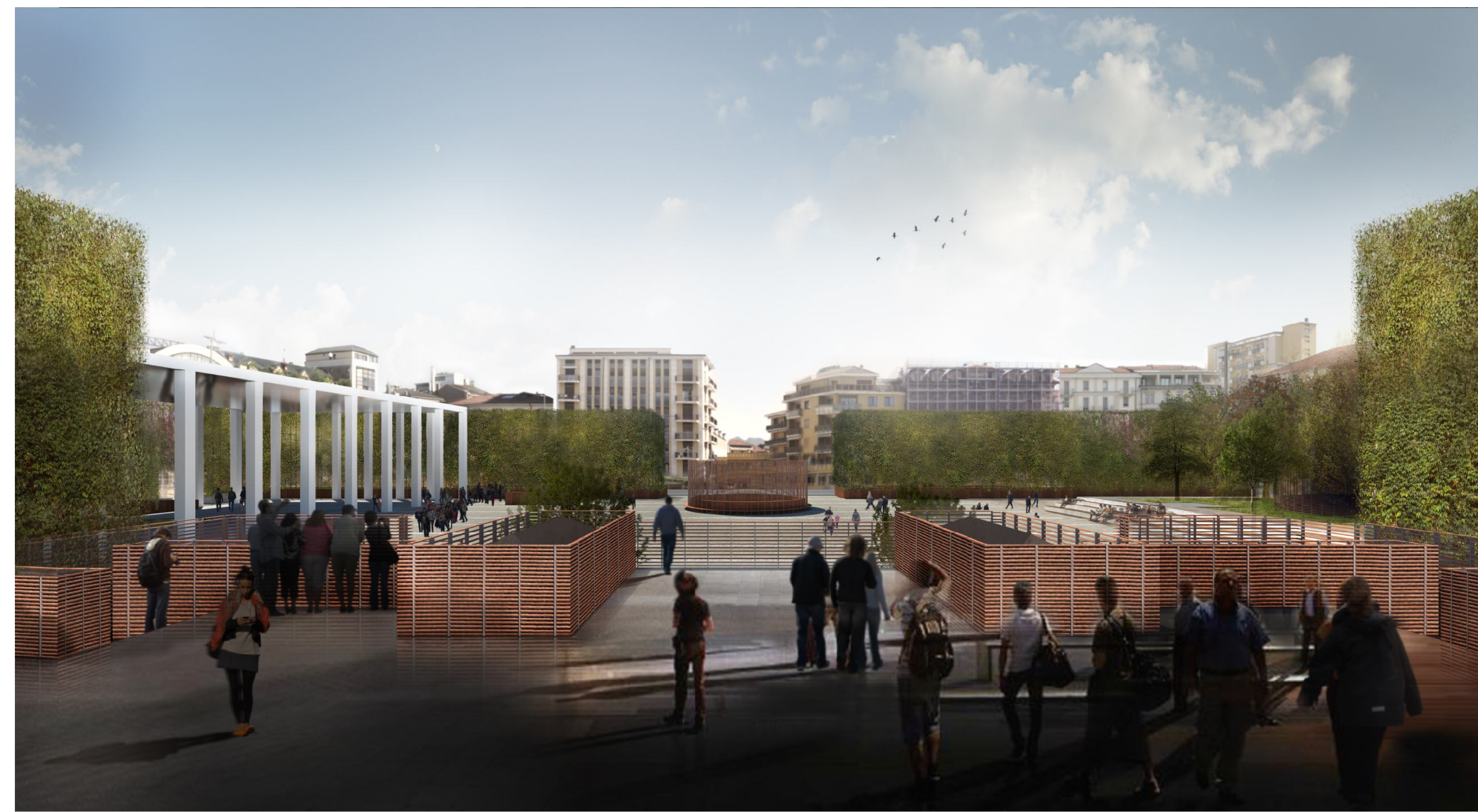
vista obbligatoria .4