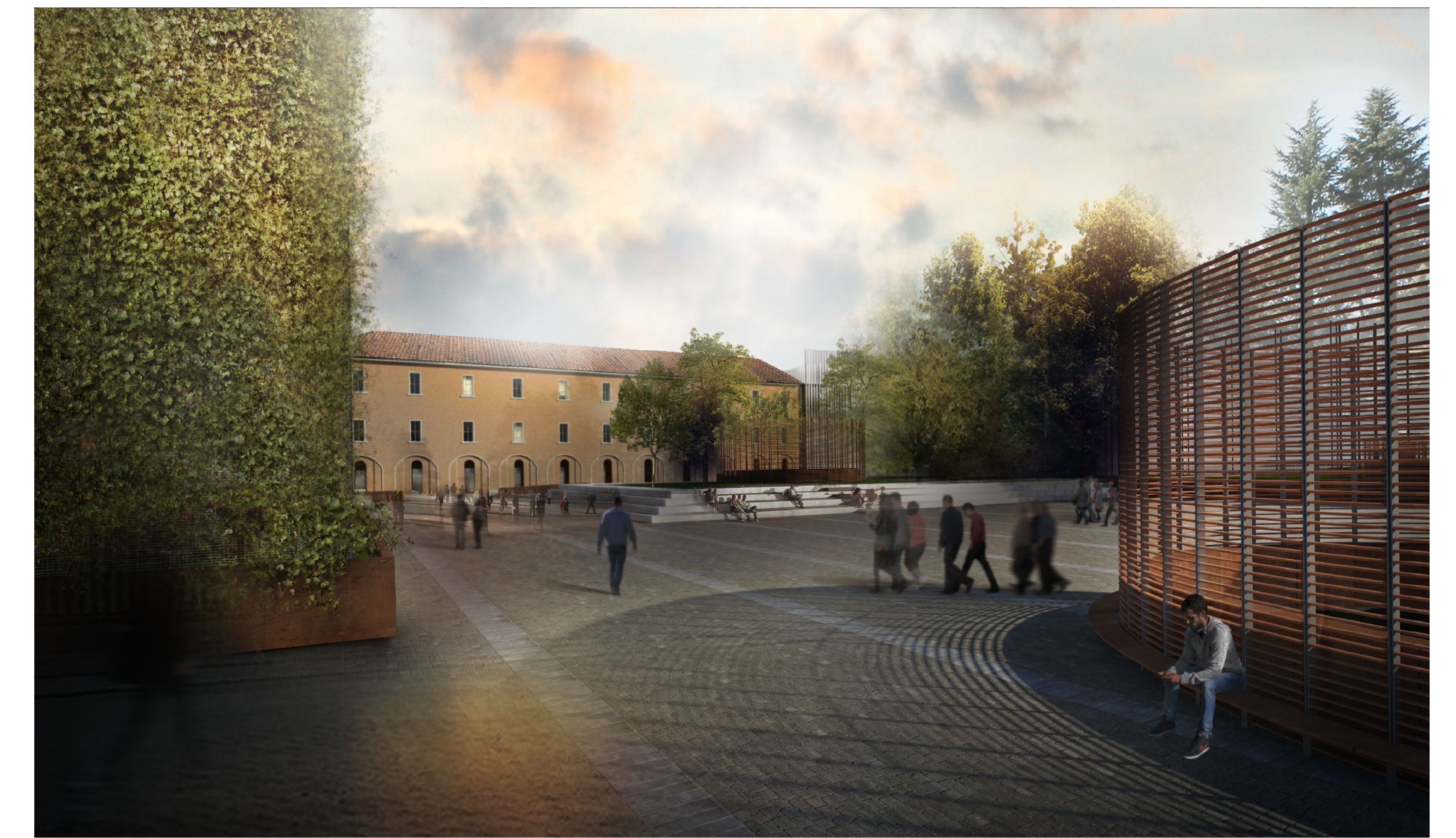
vista aggiuntiva .5