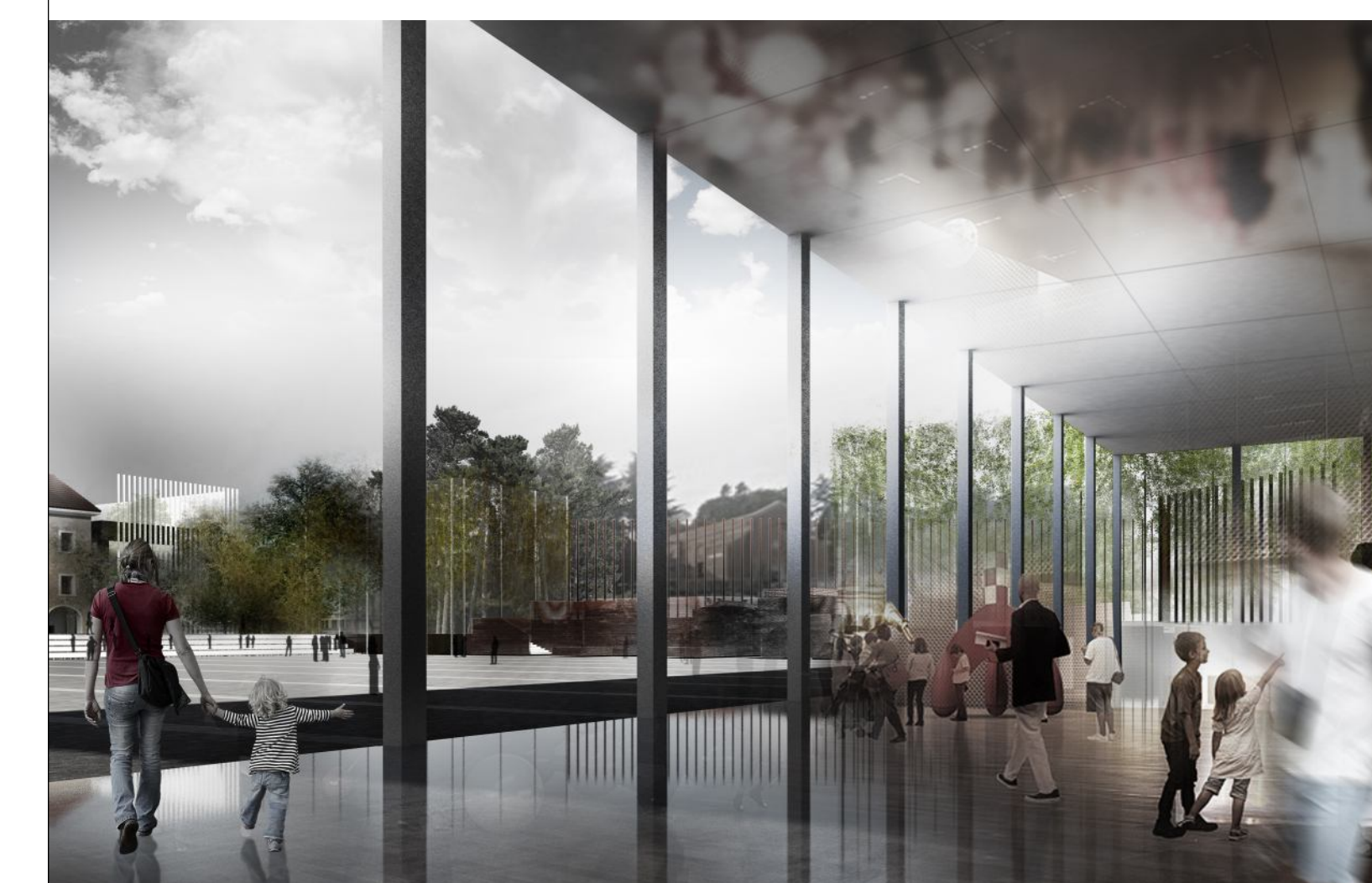
vista aggiuntiva .9