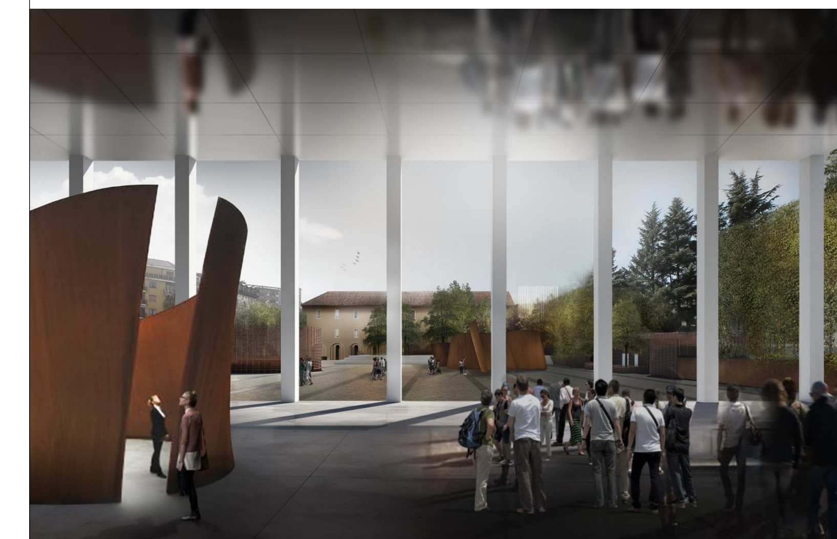
vista obbligatoria .8